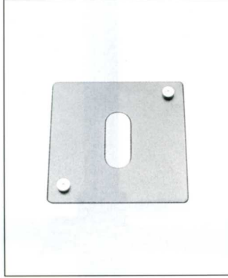
No.7531 SGA 支持台プレート

トヨプロ雲台 M-II は太い回転軸を持ち、前後ティルト、左右ティルト、パンニングは独立したロックで確実に固定できます。また、半ロック状態にもコントロールできますので、カメラアングルの微調整などもしやすくなっています。さらに、T字型水準器と各軸の目盛りも装備されています。