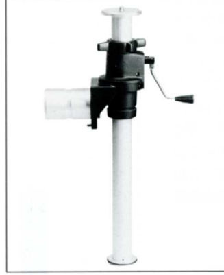
No.4011 AGE エレベーターアダプター

トヨビューカメラの支持台と、トヨプロ雲台の間にはさみこみ、カメラの回転方向のスレを確実に防止します。