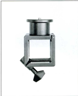
No.4213 SB80 スライドブラケット 80

スライドアーム先端に取付けて、ローアングル撮影に使用します。さらに、ハイアングル、俯瞰撮影にも威力を発揮します。