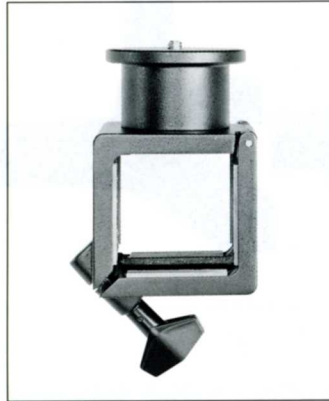
No.4013 SB100 スライドブラケット 100

標準仕様のウエイトスタンドには雲台を取付けるブラケットがアーム両端にありますが、アームの中間にスライドブラケットをセットし、もう1台の雲台を使用する事ができます。スライドブラケット 80 は TWS81 専用、スライドブラケット 100 は TWS101、101L 用です。