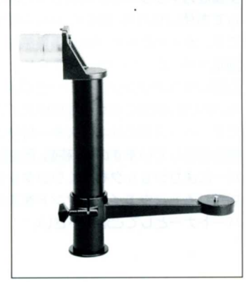
No.4012 LAP ローアングルポスト

スライドアーム先端の雲台ブラケットを外して取付けます。高さの足りない時やカメラの上下微動に便利です。