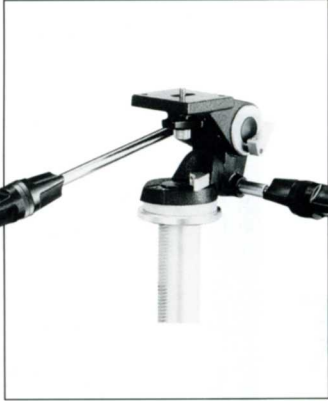
No.7501 TPPHM-II トヨプロ雲台 M-II

トヨプロ雲台 M-II は太い回転軸を持ち、前後ティルト、左右ティルト、パンニングは独立したロックで確実に固定できます。また、半ロック状態にもコントロールできますので、カメラアングルの微調整などもしやすくなっています。さらに、T字型水準器と各軸の目盛りも装備されています。