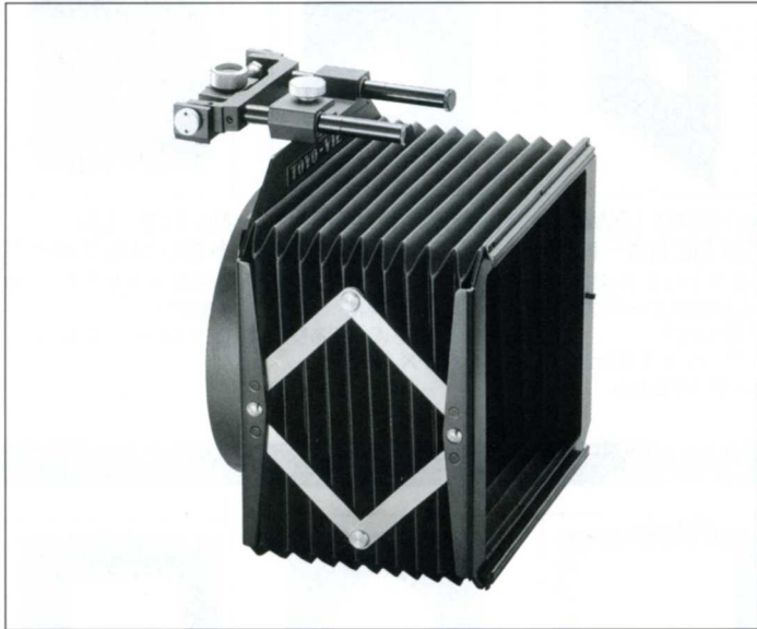
No.8060 HVG ビュー用自在フード

4×5、8×10のトヨビューとフィールド810MII用の自在レンズフードです。蛇腹式で自由に長さが調節でき、フードのアオリも可能です。フード自体の前後移動やはね上げもワンタッチ。レンズ交換にも不自由はありません。有効穴径も126mmと大きく、殆どの市販されているレンズに対応します。ゼラチンフィルターも付属のゼラチンフィルターホルダーにはさみ込み、フードの前後どちらにでもセットできます。フィルターホルダーは別売りアクセサリーとして3、4、5インチ用をご用意しています。フードの摺動パイプは短焦点レンズ使用時に写り込む事を避ける為、全長69.5mmですが、先端より26.5mmの位置で分割できるようになっており、逆に前玉の長いレンズに使用する時には取替え式の長摺動パイプ(HVG-ET81.5mm)がアクセサリーとしてあります。HVG-ETを取付けた状態ではパイプの全長が124.5mmとなります。フィルターホルダーは最初に3サイズのもの各1枚ずつセットしてあります。