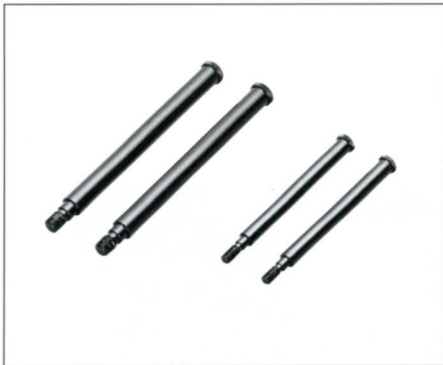
No.8062 HVG-ET 81.5mm No.1662 H4F-ET 56mm