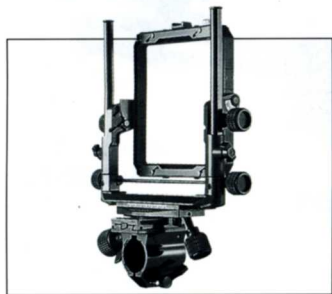
No.11403 FF45G II 45G II 前枠

トヨビュー “G シリーズ” は一貫した設計思想と製造技術により8×10から4×5まで同一のレールにセットされています。そのスムーズなムーブメントと高精度の堅牢性は、常に安定した撮影をお約束します。又豊富なアクセサリと互換性により、多彩なニーズにもお応えできる充実のシステムと言えます。