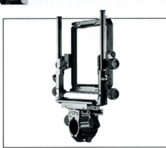
No.11404 FA45G II 45G II 後枠