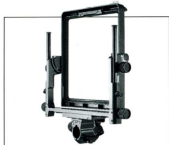
No.11604 FA810G II 810G II 後枠