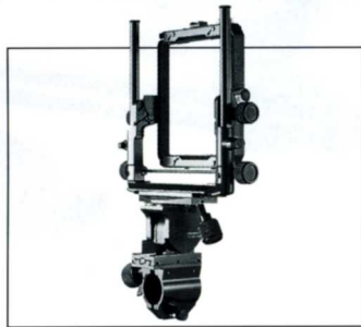
No.10803 FF45GX 45GX 前枠