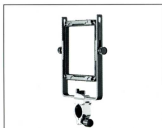
No.8081 SF45G 蛇腹延長補助フレーム

補助フレームの枠はトヨ・規格になっており、ジャバラ延長の中間枠として又、複写、接写用の資料枠、光路変更、合成写真用のミラーホルダーに便利です。