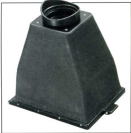
No.1024 FH45L 45 ルーペ式フード

柔軟なゴム製単眼ルーペで約 1.5 倍の像を見る事ができます。小さくたたむことができます。