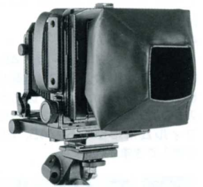
ハレーション防止効果抜群 バルーンフォーカシングフード

ビューカメラでのピント合わせは慣れる迄なかなか大変。でもミラー式フォーカシングフードを使えば楽々。双眼で正立像を見る事ができ、しかもミラーの角度を変えて画面の隅々まで丹念にチェックすることが出来ます。