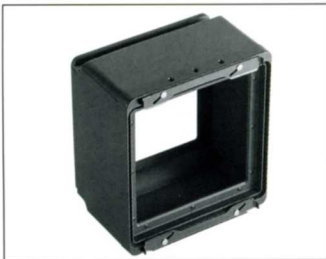
No.1635 EXT45A 45A 延長チューブ 45A 等に取付けてフランジバックを 100mm 延長します。