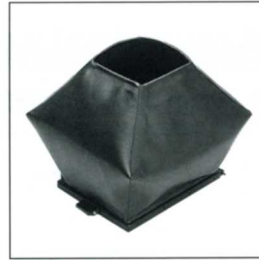
No.11425 FH45BL 45 バルーンフォーカシングフード カブリ布を使わなくてもピントガラスの映像が見やすくなります。使用後は折りたたみ収納します。