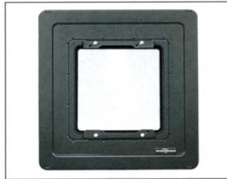
No.1830 RB4V8M 810 → 45 縮小アダプター トヨ・8×10" 規格のカメラにトヨ・4×5" 規格のバックアクセサリーを取付ける縮小アダプター。 当り面寸法 1.6mm