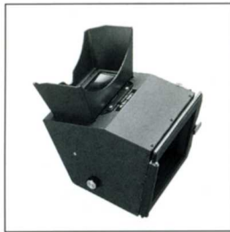
No.1026 FH45R 45 ミラー式フード

柔軟なゴム製単眼ルーペで約 1.5 倍の像を見る事ができます。小さくたたむことができます。