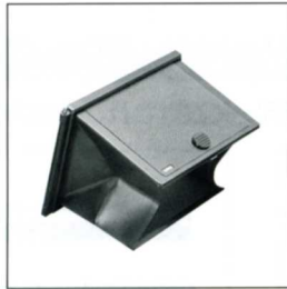
No.2006 FH45MB 45 おりたたみ式フード 周辺光を防ぎ、像を明るく見せピントガラスを保護します。