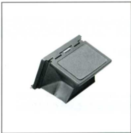
No.1039 FH23S QRS 用おりたたみ式フード クイックロールスライダの折りたたみ式フード。

トヨ・8×10 規格のカメラバック用ミラー式フォーカシングフード約 1.5 倍の拡大正立像を両眼で見ることができるミラーボックス。縦横差替式です。