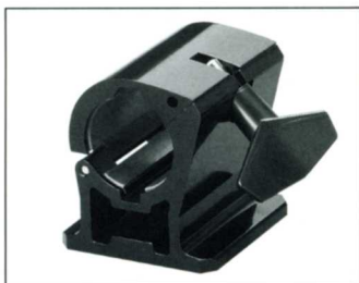
No.8208 OBS8G 810G 用支持台