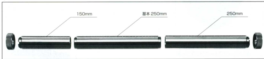
No.10115 OBE150R 延長モノレール 150mm

☆トヨビュー G シリーズ、45C、ROBOS のモノレールは 39mm の直径で断面形状が同一に設計され、全機種に流用が可能です。