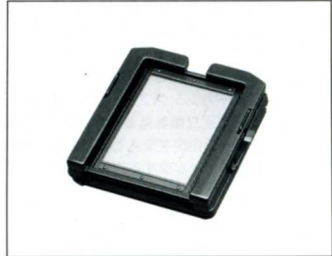
No.8005 CB45G 45G カメラバック

リボルビング方式採用の 4 × 5 カメラバックは 360 度フリーターン。クリックストップにより 90 度毎に固定することが出来、画像の傾き等はカメラを動かすことなく簡単に修正出来るのです。中間位置での撮影の場合、各 90 度位置より約 ± 10 度程の位置でのケラレはありませんが、その他の位置での短焦点レンズ使用の場合は若干のケラレが生じますのでご注意ください。