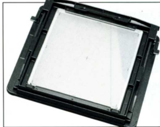
No.8205 CB810G 810G カメラバック

トヨビュー、トヨフィールド 45 用の標準カメラバック。360° 回転リボルビング式。10mm ピッチ透光ライン入。ユニバーサルバック。トヨロールフィルムホルダー 67/45、69/45 が挿入できます。