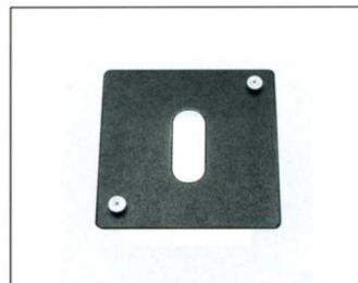
No.7531 SGA 支持台プレート

トヨビューカメラの支持台と、トヨプロ雲台の間にはさみこみ、カメラの回転方向のスレを確実に防止します。