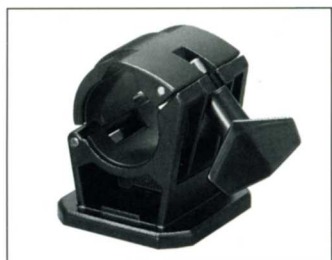
No.8008 OBSG 45、57G 用支持台