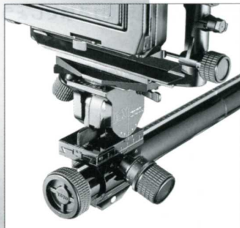
被写界深度スケール

独自の二重ティルト軸構造により、アオリ使用時における枠ねじれを防ぐヨーフリー機構を採用。従来より精度の高いアオリ効果のコントロールを実現。